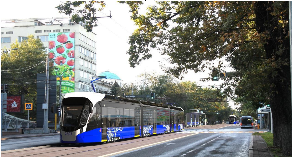
ЛРТ на пересечении пр. Абылай хана и ул. Гоголя

ЛРТ будет являться украшением города, трасса будет объединять центры культурно-бытового обслуживания отдаленных районов и новостроек Алматы с объектами обслуживания городского значения.